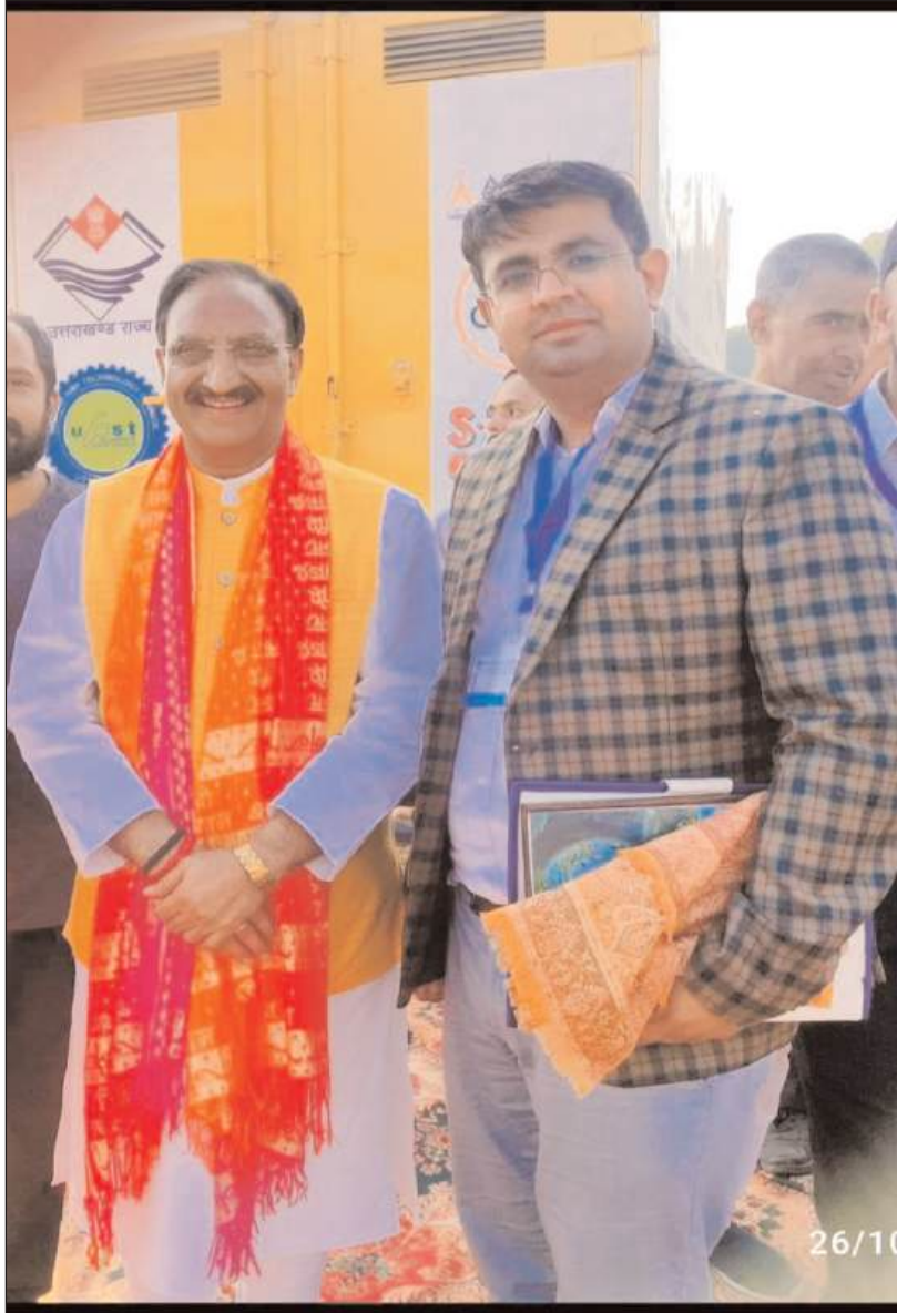
कला के माध्यम से भारतीय धरोहर को संजोए रखने में सहायक सिद्ध होगा।

देवभूमि उत्तराखण्ड का यह "लेखक गाँव" प्रदेश की अद्भुत रचनात्मकता और सृजनशीलता का प्रतीक है। यहाँ का शांत और सुरक्षित वातावरण लेखकों को सर्जन के लिए एक आदर्श स्थान प्रदान करता है। चिंतन, मनन और स्वयं की खोज में "लेखक गाँव" जैसे स्थानों की महत्ता है। लेखक गाँव के "स्पर्श हिमालय महोत्सव-2024" ने साहित्यिक और सांस्कृतिक जागरूकता का नया अध्याय लिखा है। यह आयोजन न केवल उत्तराखण्ड की धरती पर रचनात्मकता का संचार लाया है बल्कि साहित्य, संस्कृति और