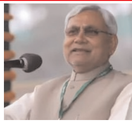
अपनी भावभीनी श्रद्धांजलि अर्पित की।

पटना। पूर्व प्रधानमंत्री व भारत रत्न अटल बिहारी वाजपेयी की आज पुण्यतिथि है। मुख्यमंत्री नीतीश कुमार ने अटल बिहारी वाजपेयी की पुण्य तिथि को राजकीय समारोह के रूप में मनाए जाने की घोषणा की है। अटल बिहारी वाजपेयी की पुण्य तिथि के अवसर पर राज्यपाल राजेन्द्र विश्वनाथ आलेंकर और मुख्यमंत्री नीतीश कुमार ने शुक्रवार को पार्टीलुपुत्रा पार्क में प्रतिमा पर माल्यार्पण कर